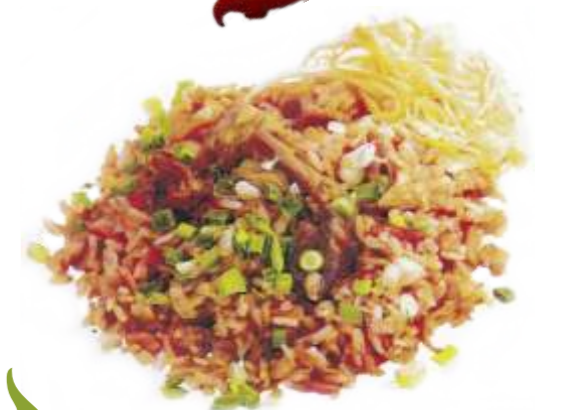
Узбекский плов "Водий"

настоящий узбекский плов из баранины, из риса дивзира