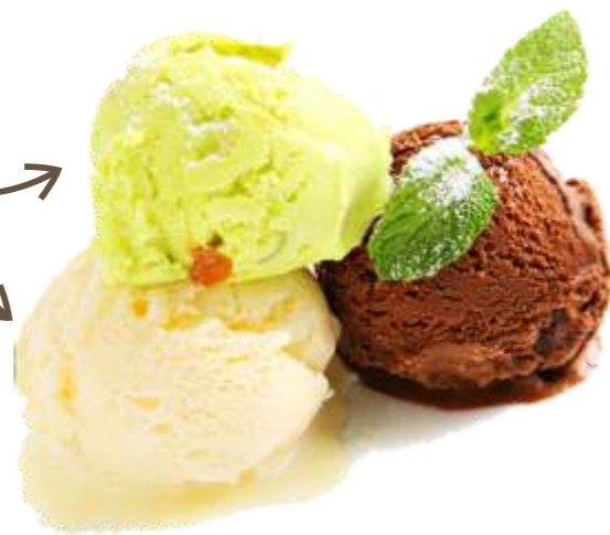
Фисташковое 80 р. 100 гр.