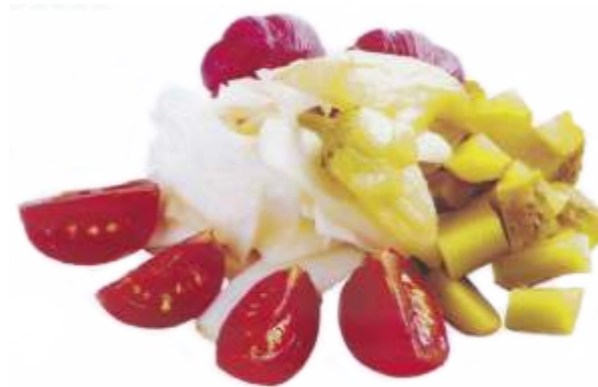
Разносолы "Тузланган" ассорти из солений и маринадов 150 р. 240 гр.