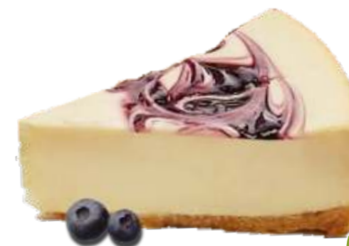
Чиз-кейк с ягодами 130 р. 105 гр.