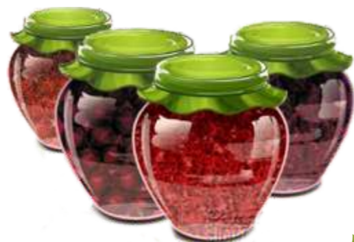
Варенье в ассортименте 60 р. 50 гр.