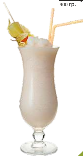
Гейша мороженное, сок яблочный, сок ананасовый, персик, сироп, дынный сироп, взбитые сливки 180 р. 400 гр.