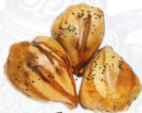
Самса из тандыра с телятиной