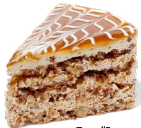
Торт "Эстерхази" 120 р. 100 гр.