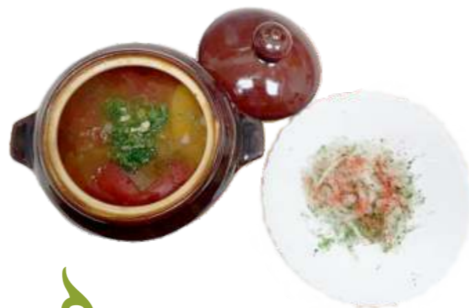
“Куза Шурпа” шурпа из баранины с овощами в горшочке 190 р. 500 гр.