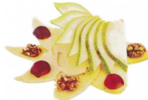
Сырная тарелка сыр ламбер, масдам, тильзитер, грецкий орех, груша 320 р. 250 гр.