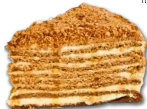
Торт "Медовик" 110 р. 120 гр.