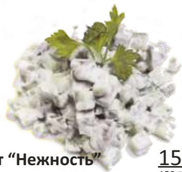
Салат "Нежность" 150 р. 150 гр. язык говяжий, огурец, зеленый горошек, майонез