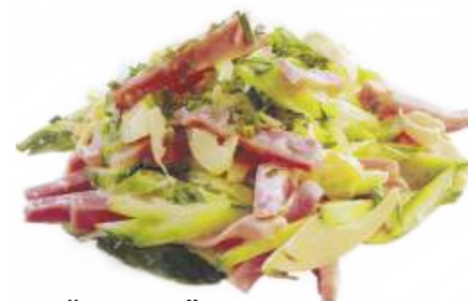
Салат "Дархан" ветчина куриная, пекинская капуста, огурец, яйцо, майонез 170 р. 150 гр.