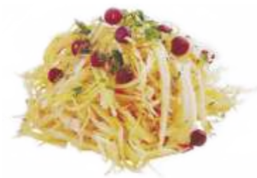
Салат капустный 80 р. 100 гр.