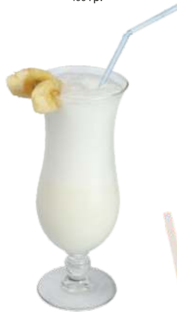
Банановый кокос банан, сливки, молоко, кокосовый сироп, банановый сироп, взбитые сливки 180 р. 400 гр.