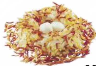
Салат "Жар-птица" 205 р. 180 гр. куриное филе, картофель отварной, яйцо перепелиное, огурец соленый, майонез