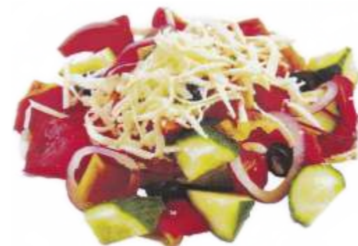
Салат с сыром "Малика" помидоры, огурцы, перец болгарский, сыр адыгейский, маслины, зелень, масло подсолнечное 180 р. 170 гр.