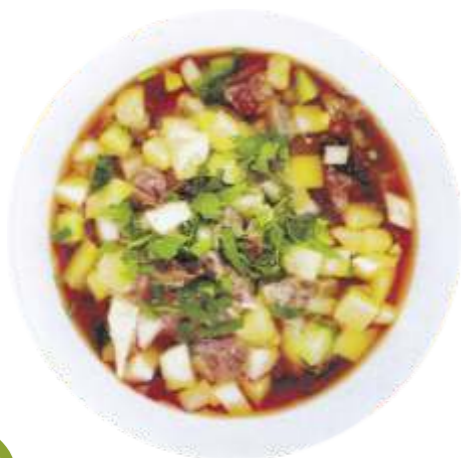
Окрошка “Назокат” на квасе 160 р. 300 гр.