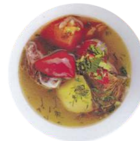
Шурпа из молодого барашка с овощами