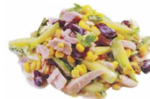
Салат "Навруз" грудка копченая, огурец, кукуруза, фасоль, майонез, зелень 180 р. 150 гр.