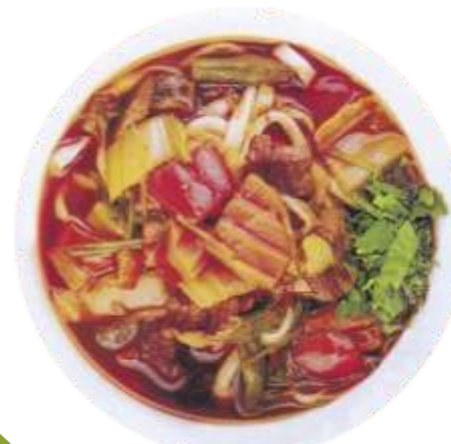
Лагман "По-узбекски" наваристый бульон из телятины с домашней лапшой и овощами