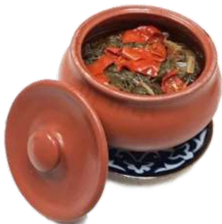
“Куза Товук” курица томленая со свежими овощами в горшочке 160 р. 500 гр.