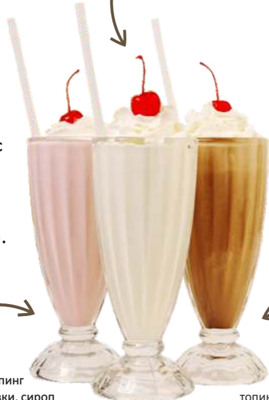
175 р. 400 гр. Фруктовый молоко, мороженное, топинг фруктовый, взбитые сливки, сироп