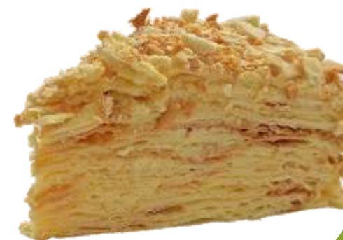
Торт "Наполеон" 120 р. 150 гр.