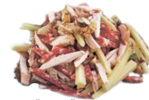
Салат "Лаззат" грудка копченая, помидор, огурец, картофель фри, яблоко, сыр, зелень, майонез 170 р. 150 гр.