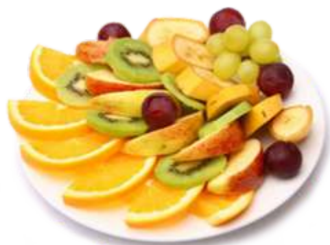
Фруктовая тарелка Яблоко, груша, апельсин, виноград, банан, киви 295 р. 850 гр.