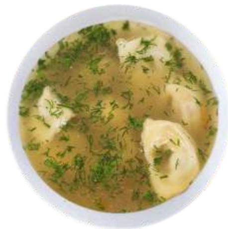
Пельмени домашние в наваристом курином бульоне с зеленью 150 р. 400 гр.