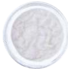
Соус белый "Айва"