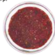
Аджика острая домашняя