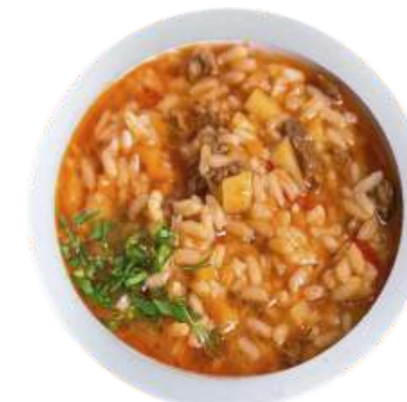
Суп "Мастава" наваристый бульон из баранины с овощами и рисом