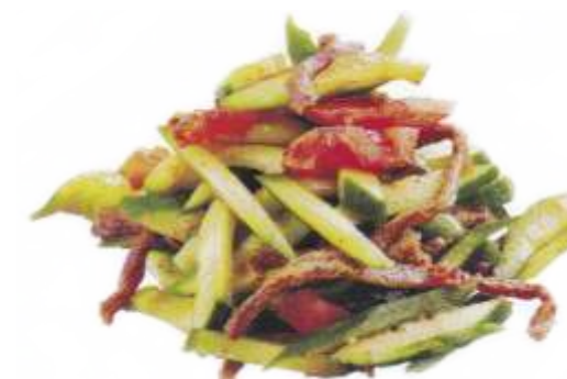
Салат "Тюбетейка" оригинальное сочетание жареной телятины в соевом соусе, свежих огурцов, помидоров, зелени с острой заправкой 210 р. 300 гр.