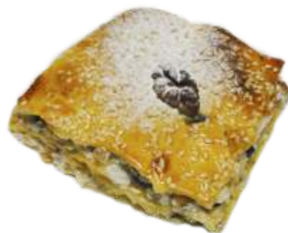
Пахлава 130 р. 100 гр.