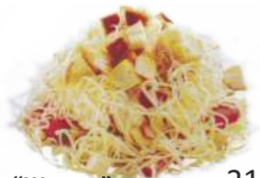
Салат "Шихан" 210 р. 200 гр. куриное филе, помидоры, перец, пекинская капуста, гренки, сыр пармезан, соус Цезарь