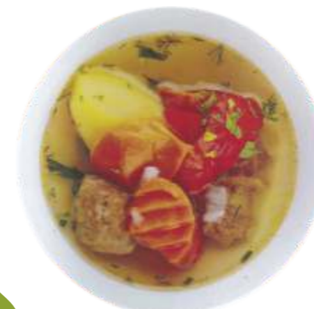
Шурпа из говядины по-домашнему с добавлением гороха нут