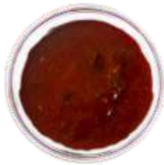
Соус томатный "Навруз"