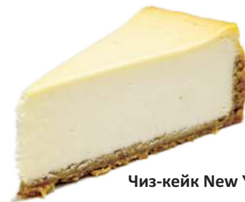
Чиз-кейк New York 130 р. 105 гр.