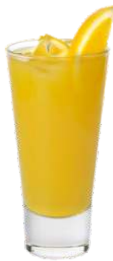
Колибри сок ананасовый, сок персиковый, фанта, гренадин, лед 185 р. 400 гр.