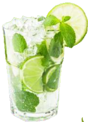
Мохито мята, лайм, швепс 160 р. 400 гр.