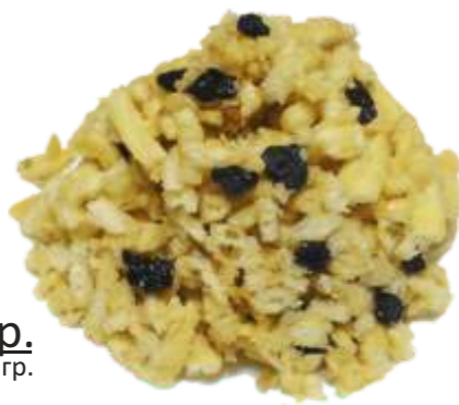
Чак-Чак 90 р. 100 гр.