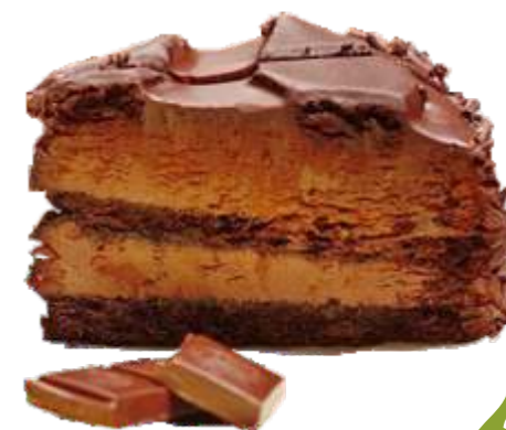
Торт "Три шоколада" 140 р. 120 гр.