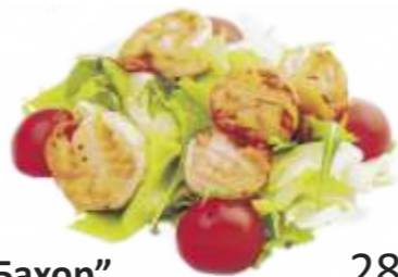
Салат "Бахор" 280 р. 180 гр. семга, руккола, салат айсберг, салатный лист, помидоры черри, фирменная заправка