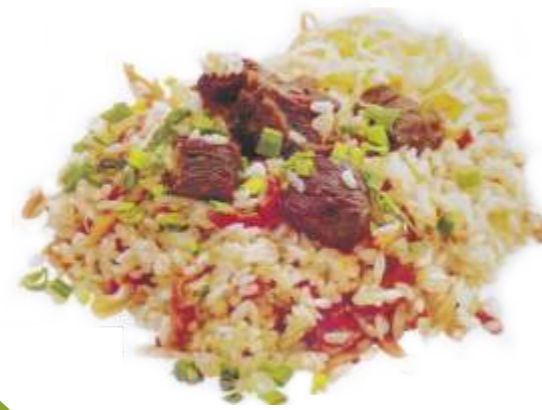
Узбекский плов "Навруз"

оригинальный узбекский плов из говядины со специями и нутом