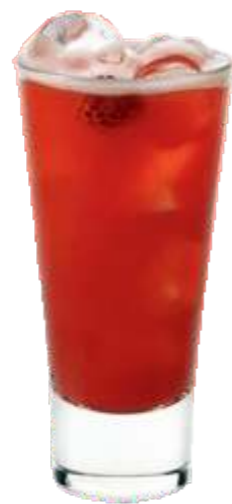
Вишневый восторг сок вишневый, сок виноградный, спрайт, гренадин, лед 165 р. 400 гр.