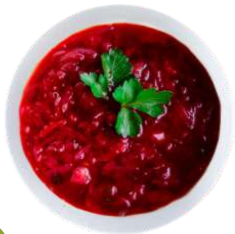
Борщ 160 р. 400 гр.