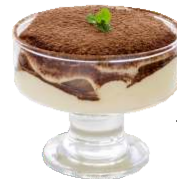
Тирамису 180 р. 210 гр.