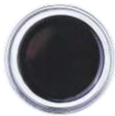
Гранатовый соус "Наршараб"