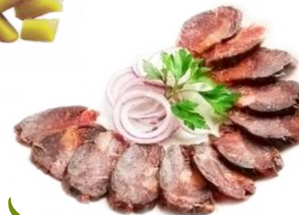
Казы из конины 120 р. 100 гр.