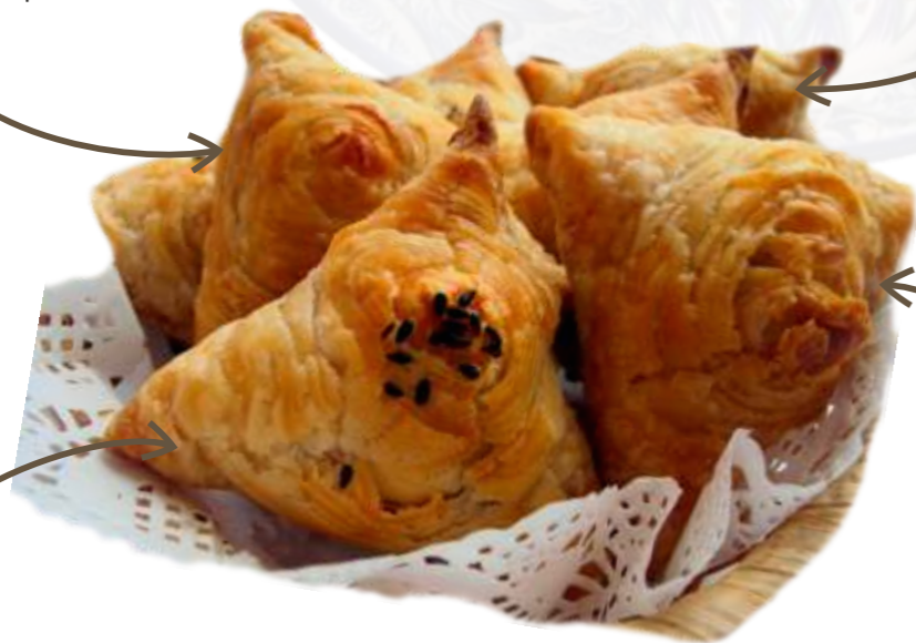
Самса слоеная из баранины с луком и специями