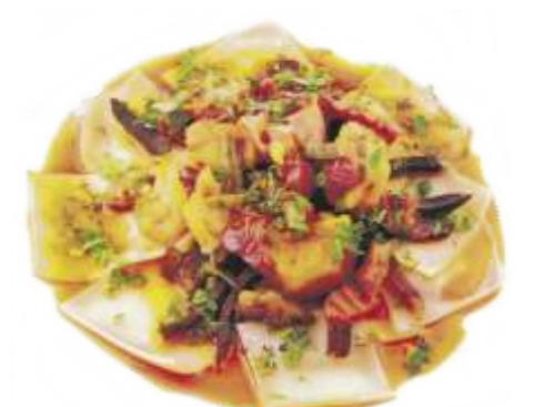
Бешбармак по узбекски "Шилпилдак"