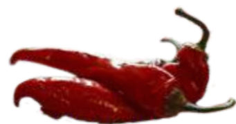
Перчик маринованный острый