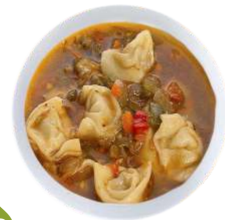
Чучвара маленькие пельмешки из говядины в наваристом бульоне с овощами