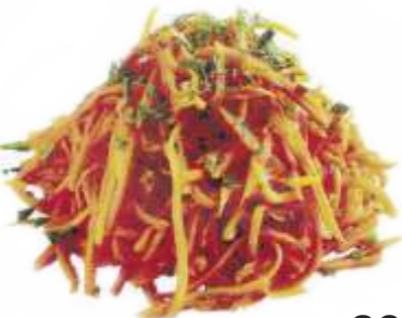
Морковь по-восточному 80 р. 100 гр.