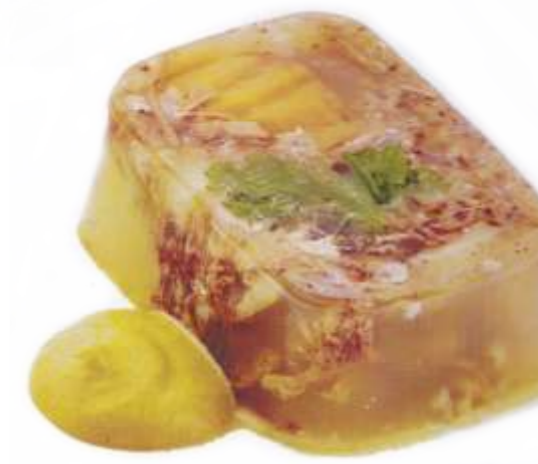
Холодец по-домашнему подается с хреном или горчицей, на выбор 120 р. 150 гр.