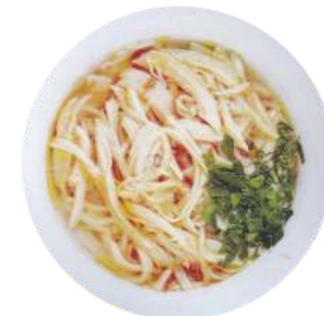
Куриный суп с домашней лапшой