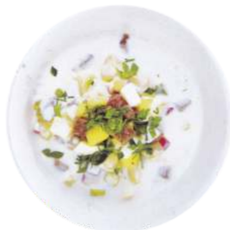
Окрошка “Назокат” на кефире 160 р. 300 гр.