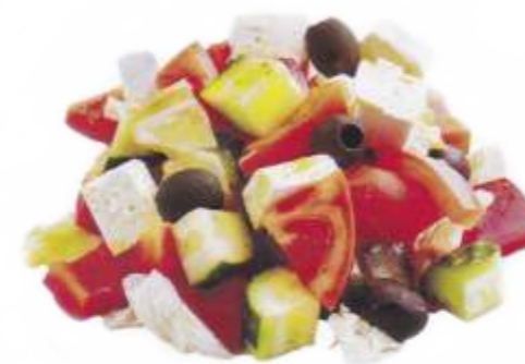
Салат "Греческий" помидоры, огурцы, перец болгарский, брынза, маслины, пекинская капуста, фирменная заправка 220 р. 200 гр.