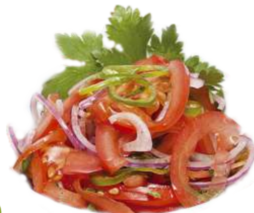
Салат "Шакароб" к плову 90 р. 150 гр. помидор, лук, зелень